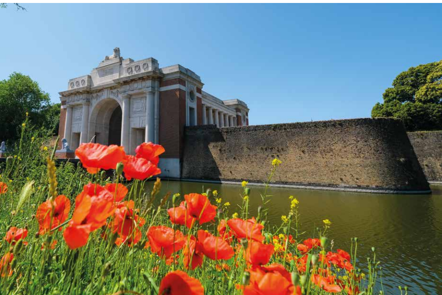
De Menenpoort, elke dag wordt hier om 20 uur de Last Post gespeeld.

sneuvelden en niet meer geïdentificeerd of teruggevonden werden. Elke dag wordt om 20.00 uur de Last Post gespeeld, als herinnering aan de gesneuvelden.