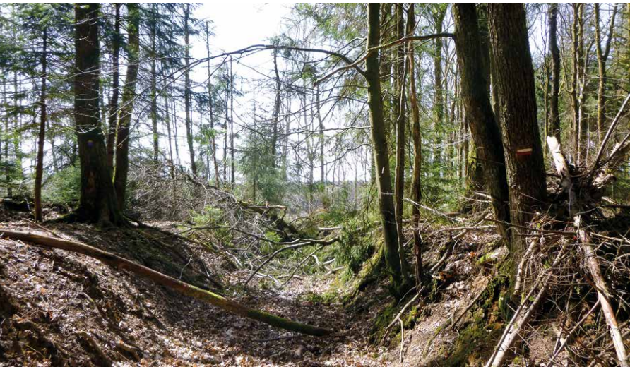
Een dichtgegroeide holle weg lijkt je tocht te beëindigen. Verder lopen op de hoger gelegen berm is de oplossing.

Wil je gewoon verder, dan loop je rechtdoor in een dalende weg. Verderop draait de weg naar links. Aan huisnummer 53 ga je scherp rechts. Wanneer na 400 m de weg naar links afbuigt, ga jij rechtdoor op een grindweg, het bos in. Na 1,6 km neem je bij een Y-splitsing de linkervork. Eén kilometer verder kom je bij een schuilhut aan een vijver. Daar wandel je naar rechts. Bij het volgende kruispunt loop je rechtdoor. Na 1,3 km kruis je een beekje en even verderop kruis je een grindweg. Na nog eens 1,2 km stap je weer over een beekje. Even verder, bij een kruispunt van boswegen, loop je rechtdoor in een holle weg. Verderop is die compleet dichtgegroeid en moet je naar de hoger gelegen rechterberm. Vervolg je weg over 400 m door een gekapte open ruimte tot je weer de weg kunt volgen. Zo kom je op een T-punt, waar je een grindweg naar links volgt. Al na 100 m