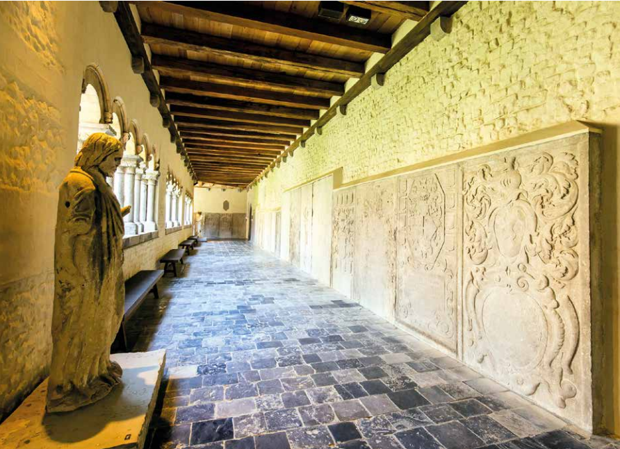
Het Teseum neemt je mee voor een fascinerende tijdreis van twee millennia.