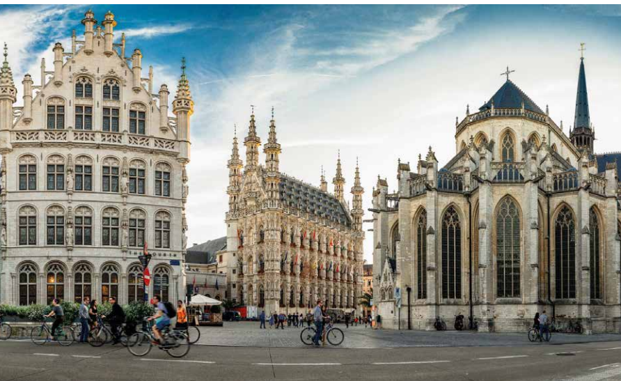
Een drie-eenheid van Brabantse gotiek: rechts de Sint-Pieterskerk, in het midden het stadhuis en links het voormalige gildehuis, nu hotel

Net voor de Mechelsestraat zie je links de Busleydengang met de restanten van het Collegium Trilingue (1518), mede gesticht door de grote humanist Erasmus. Mercator, Vesalius en Dodoens zaten hier op de banken om Latijn, Grieks en Hebreeuws te leren. Het was het eerste in zijn soort en bestond gedurende 280 jaar, tussen 1517 en 1797.